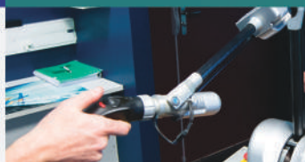
Bras haptique 6° de liberté